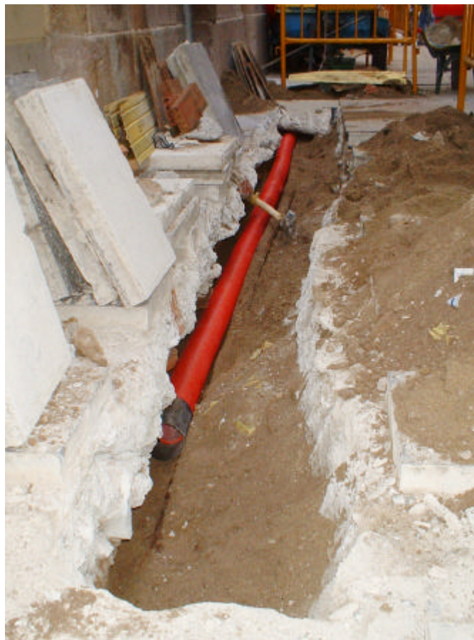
FOTOGRAFIA 3: Vista parcial de la Rasa 200 (Carrer dels Salvador).