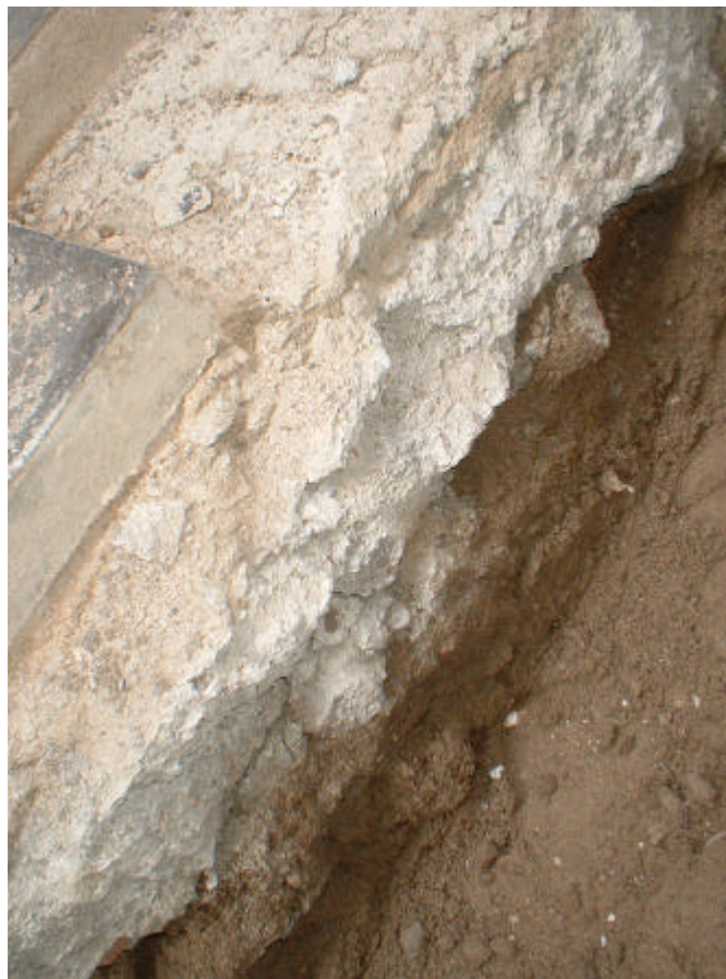
FOTOGRAFIA 4: Estratigrafia de la Rasa 200.