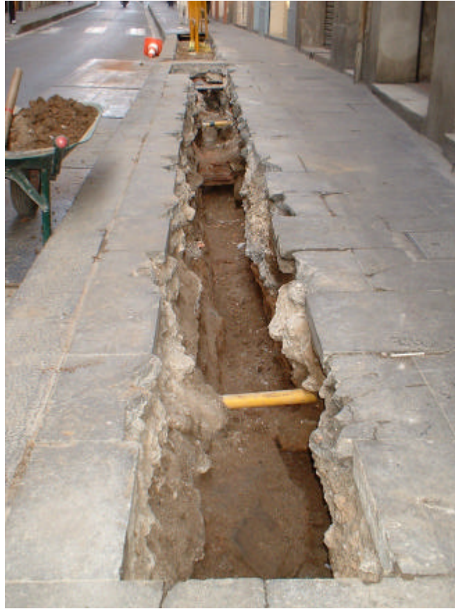
FOTOGRAFIA 1: Vista parcial de la Rasa 100 (Carrer de Sant Antoni Abat).