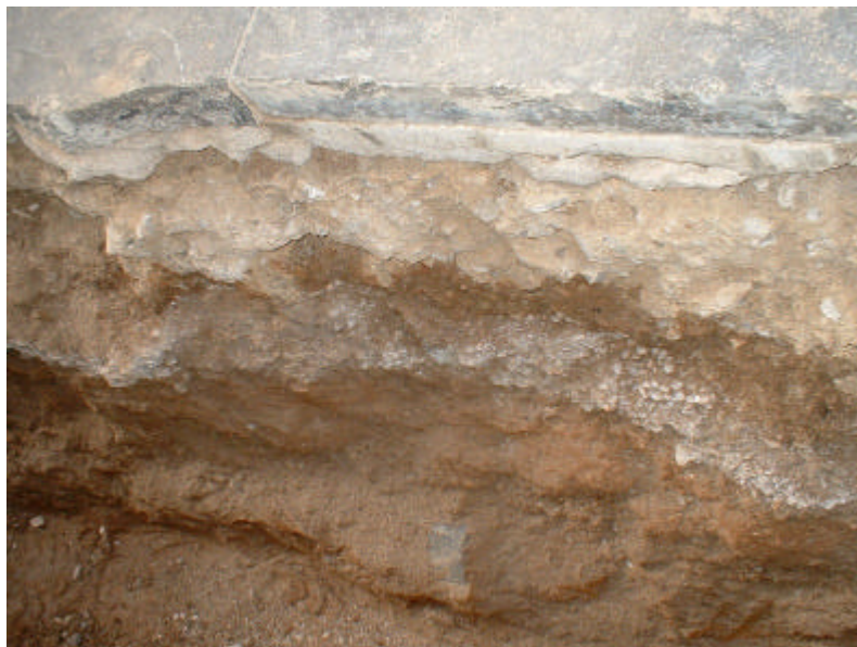
FOTOGRAFIA 2: Estratigrafia de la Rasa 100.